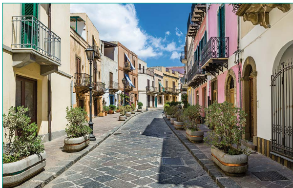
Lipari – der Hauptort der Liparischen Inseln – auf der gleichnamigen Insel zählt rund 5.000 Einwohner.

Nach dem Frühstück fahren Sie vorbei am mächtigen Vulkan Ätna und der Straße von Messina – der Meerenge zwischen Sizilien und der Region Kalabrien auf der italienischen Halbinsel – nach Milazzo an der Nordküste. Mit dem Schiff setzen Sie nach Lipari, dem Hauptort der gleichnamigen Insel, über. Nach der