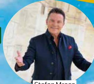
Stefan Mross