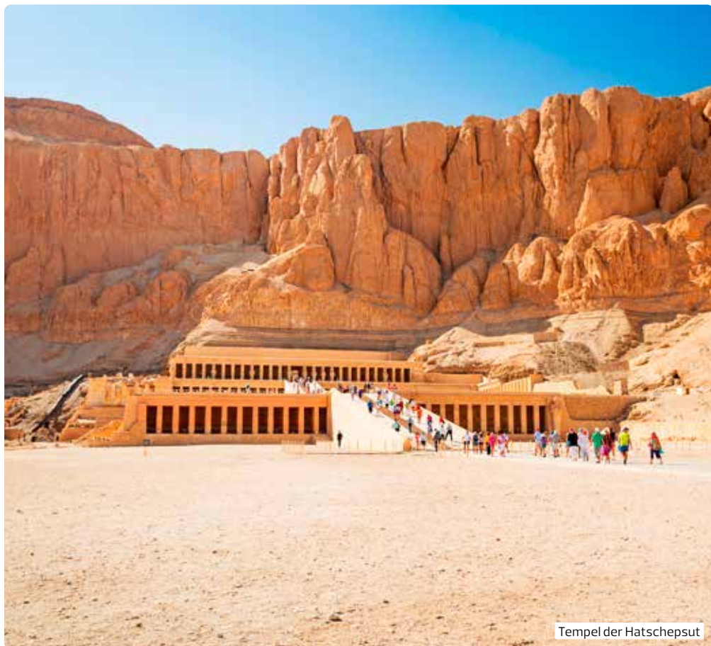
Tempel der Hatschepsut