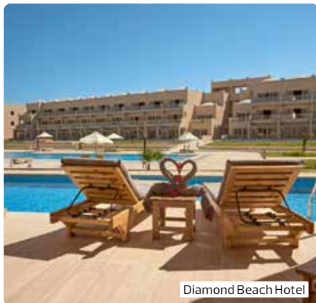
Diamond Beach Hotel