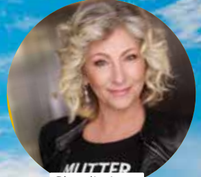
Claudia Jung