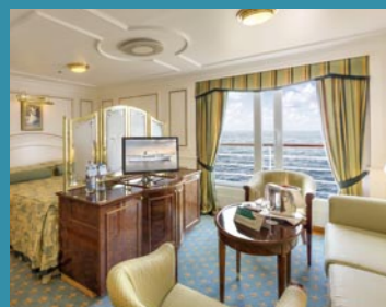
2-Bett-Suite außen, franz. Balkon, Admirals-Deck (Kat. T)