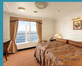
2-Bett-Junior-Suite, außen, franz. Balkon, Admirals-Deck (Kat. S)