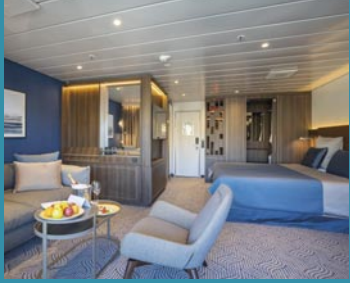
2-Bett-Suite, Balkon, Lido-Deck (Kat. V)