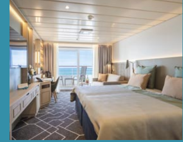
2-Bett-Junior-Suite, Balkon, Jupiter-/Lido-Deck (Kat. S, T)