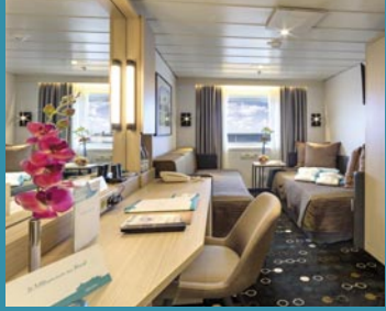
2-Bett außen, Neptun-/Saturn-/Orion-/Apollo-Deck (Kat. I, J, K, M, O, J1, L)