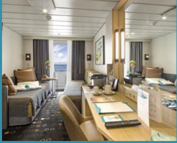
2-Bett-Superior, Balkon, Orion-/Apollo-/Jupiter-Deck (Kat. PG, P, Q, R, Q1)