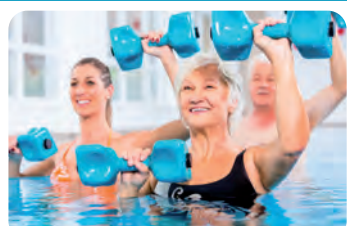
mit AQUA KINETIK, RÜCKENGYMNASTIK u. v. m.

Durch den Einsatz verschiedener Hilfsmittel (z. B. Hanteln) werden unterschiedliche Muskeln schonend trainiert.