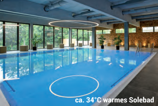
ca. 34°C warmes Solebad