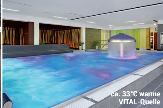
ca. 33°C warme VITAL-Quelle