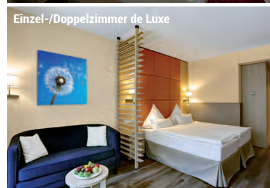
Einzel-/Doppelzimmer de Luxe