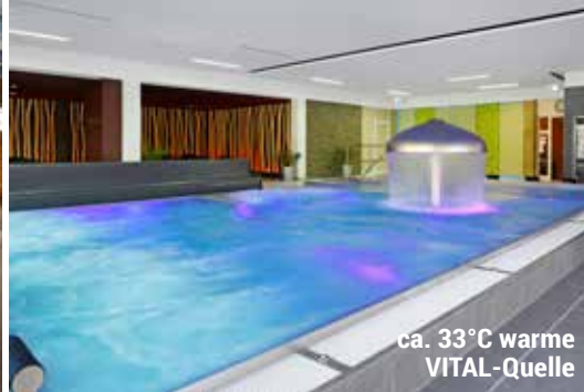
ca. 33°C warme VITAL-Quelle