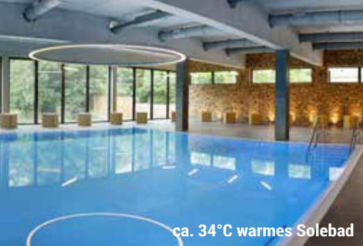
ca. 34°C warmes Solebad