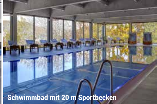
Schwimmbad mit 20 m Sportbecken