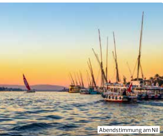
Abendstimmung am Nil