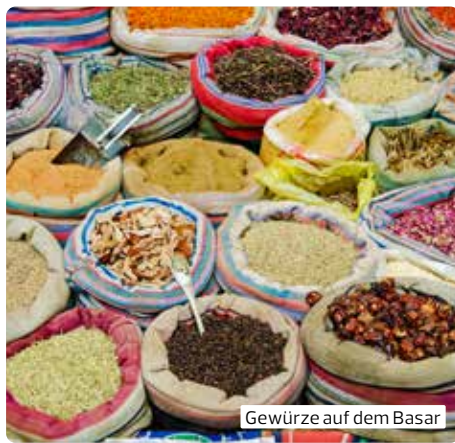
Gewürze auf dem Basar