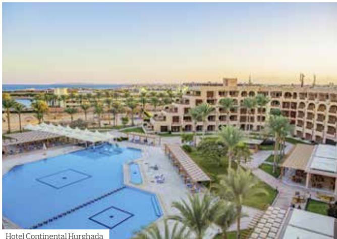
Hotel Continental Hurghada