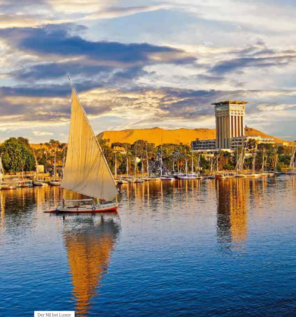
Der Nil bei Luxor