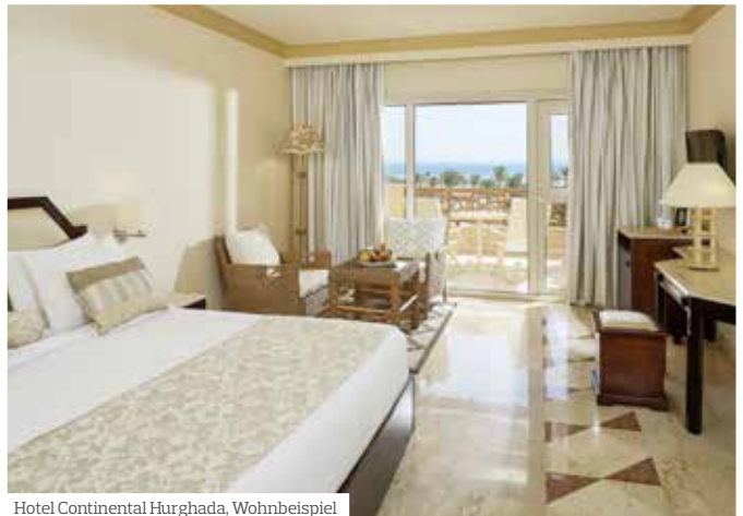
Hotel Continental Hurghada, Wohnbeispiel

se ein Visum. Dieses kann bei Einreise nach Ägypten vor Erreichen der Passkontrolle kostenpflichtig am Agenturschalter oder an einem Bankschalter erworben werden. Die Gebühr beträgt für eine einfache Einreise 25,- USD (Stand 6/2022). Abweichungen der Gebühren vor Ort sind möglich. Bitte beachten Sie, dass für andere Staatsangehörige andere Einreise- und Visabedingungen gelten können.