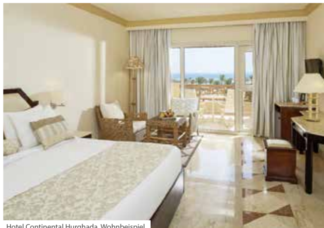
Hotel Continental Hurghada, Wohnbeispiel

se ein Visum. Dieses kann bei Einreise nach Ägypten vor Erreichen der Passkontrolle kostenpflichtig am Agenturschalter oder an einem Bankschalter erworben werden. Die Gebühr beträgt für eine einfache Einreise 25,- USD (Stand 6/2022). Abweichungen der Gebühren vor Ort sind möglich. Bitte beachten Sie, dass für andere Staatsangehörige andere Einreise- und Visabedingungen gelten können.