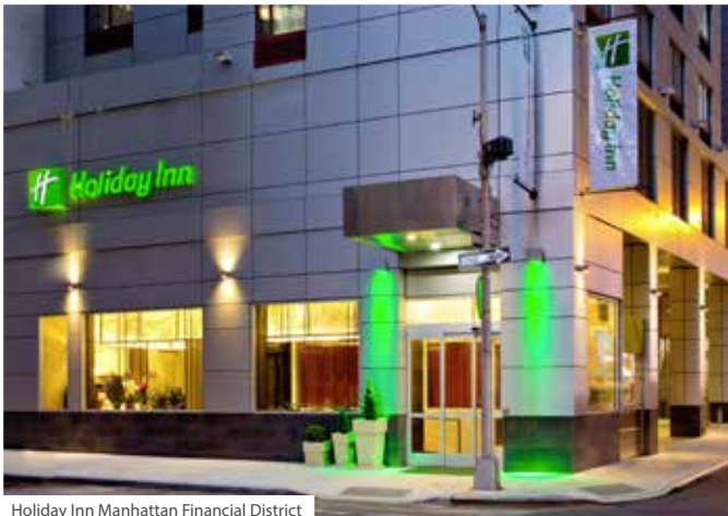
Holiday Inn Manhattan Financial District