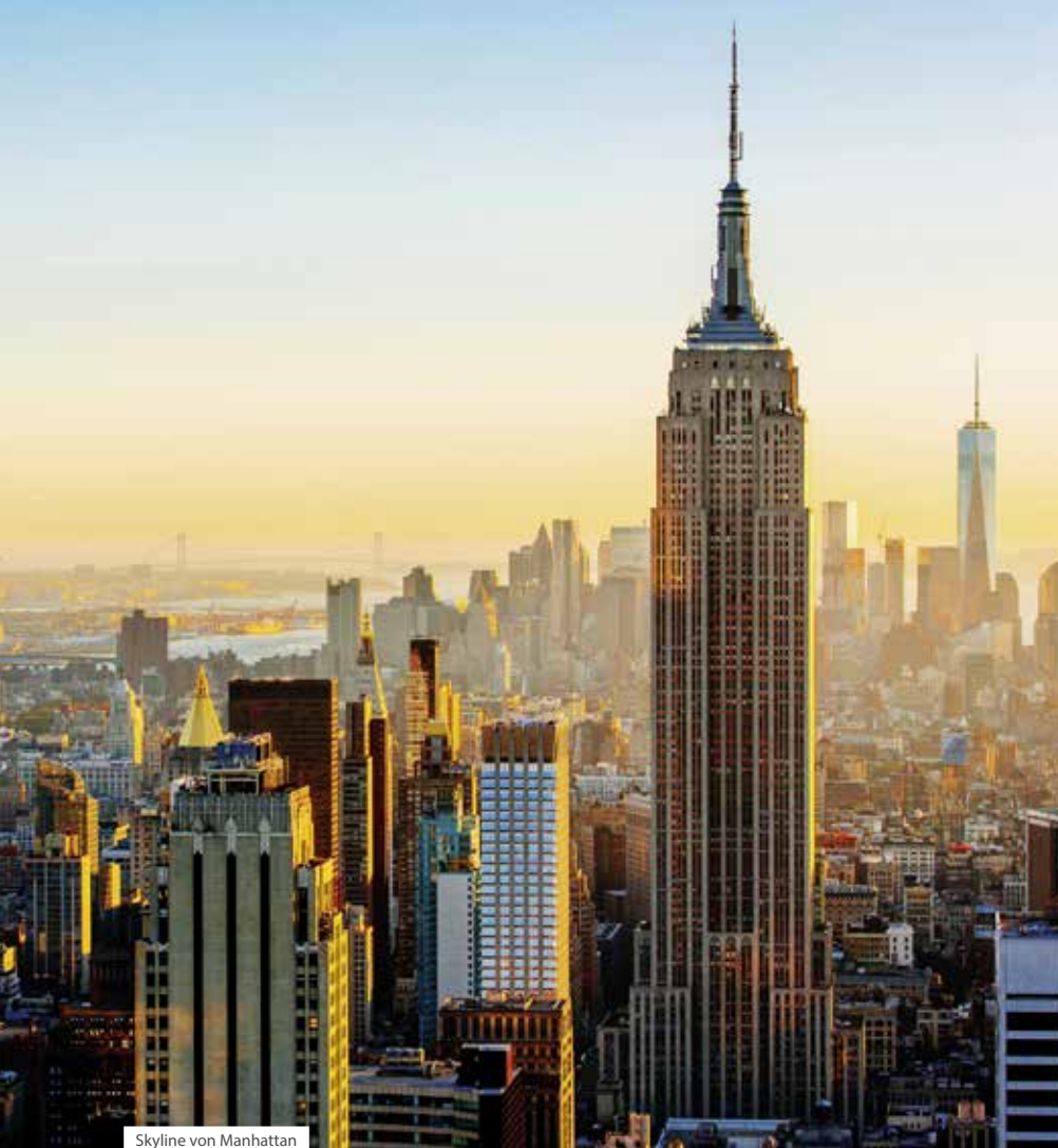
Skyline von Manhattan