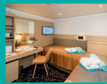
2-Bett, Superior, Balkon, Salon-/Apollo-Deck (Kat. P, Q, Q1)