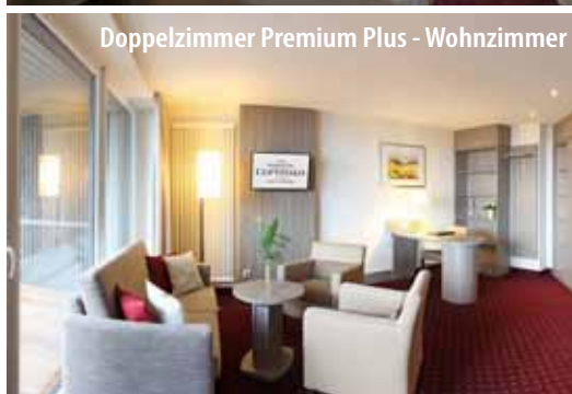
Doppelzimmer Premium Plus - Wohnzimmer