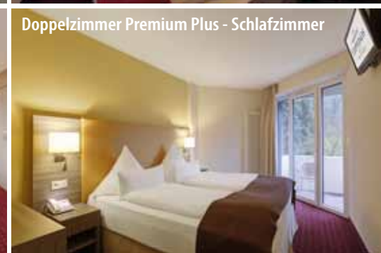
Doppelzimmer Premium Plus - Schlafzimmer