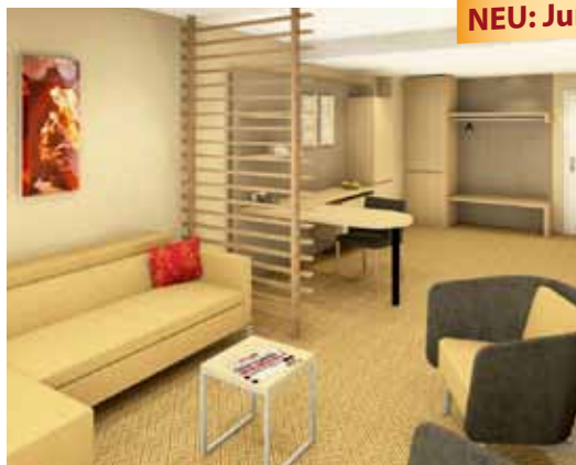
NEU: Junior Suite