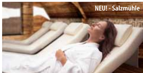
NEU! - Salzmühle

Bei Anreise vom 29.06. – 14.12.2021 erhalten Sie dieses Anwendungspaket: