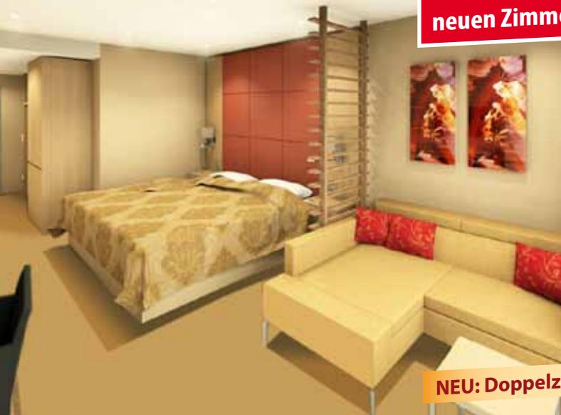
NEU: Doppelzimmer de Luxe

Ab Juli 2021 mit neuen Zimmerkategorien!