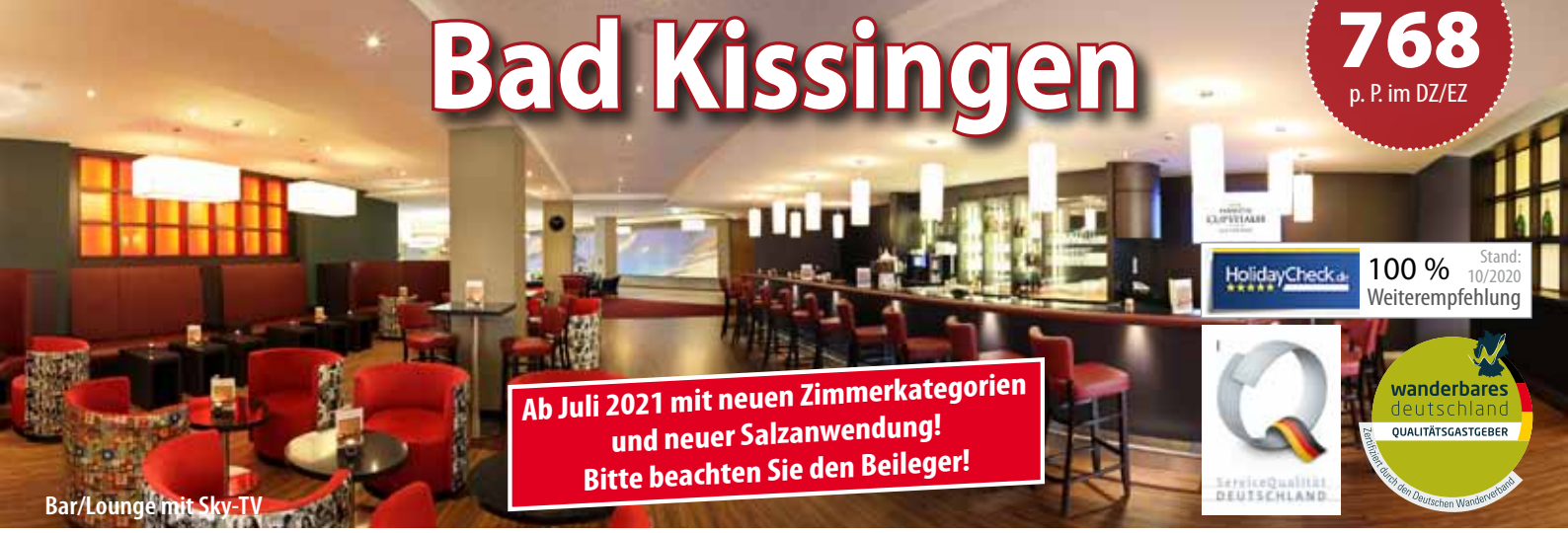
Bar/Lounge mit Sky-TV

Ab Juli 2021 mit neuen Zimmerkategorien und neuer Salzanwendung! Bitte beachten Sie den Beileger!