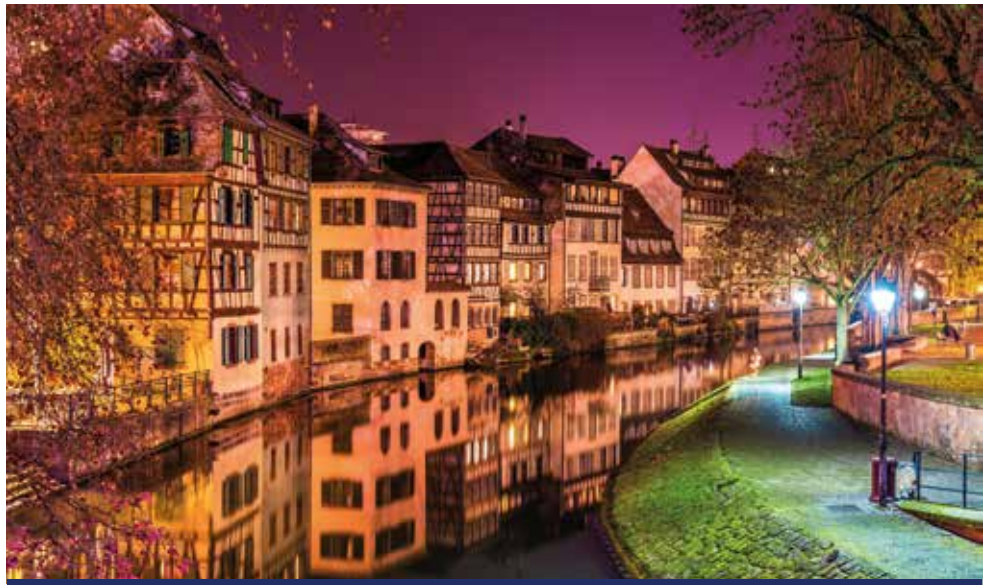
La Petite France ist vielleicht das charmanteste Stadtviertel, das Straßburg zu bieten hat