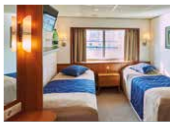
Zweibett, außen, Oberdeck große Fenster

Trinkgelder, Landausflüge, zusätzliche Veranstaltungen und private Ausgaben sind nicht im Reisepreis eingeschlossen.