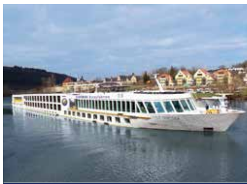
MS ROUSSE PRESTIGE – Die elegante Art zu Reisen