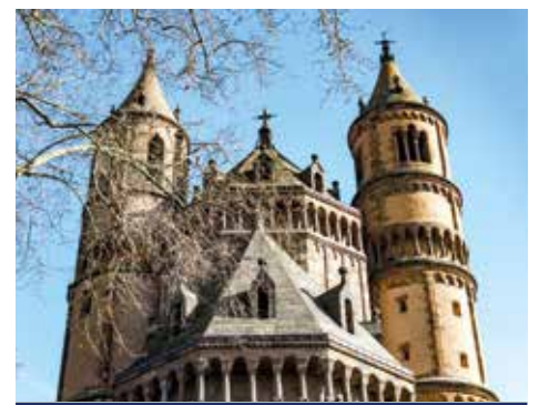
Der Dom St. Peter zu Worms ist der kleinste der drei rheinischen Kaiserdomme