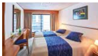
2-Bettkabine Deluxe mit franz. Balkon