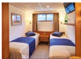
Zweibett, außen, Hauptdeck kleine Fenster

Reisepapiere: Deutsche Staatsangehörige benötigen einen gültigen Reisepass oder Personalausweis. Für alle anderen Nationalitäten werden wir eine Optionsbuchung tätigen und innerhalb von 7 Tagen über die für Sie zutreffenden Reisepapiere informieren.