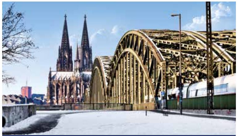
Zur Winterzeit in Köln

Nostalgische Städte, ein malerischer Fluss und eine tolle Silvester-Gala an Bord – was will man mehr? An den Ufern stehen die stolze Festung Ehrenbreitstein, die sagenumwobene Loreley, die Weinstadt Rüdesheim und der Speyerer Kaiser- und Mariendom Spalier, wenn Sie sich auf den Weg ins neue Jahr machen. Beschwingt in Straßburg angelegt, feiern Sie um Mitternacht auf MS ROUSSE PRESTIGE ins neue Jahr hinein und sehen seinen ersten Abenteuern entgegen: Genießen Sie in Mannheim einen köstlichen Neujahresbrunch, wandeln Sie in Worms auf den Spuren der Nibelungen und überqueren Sie in Mainz den 50. Breitengrad. Abwechslungsreicher kann man kaum ins neue Jahr starten!