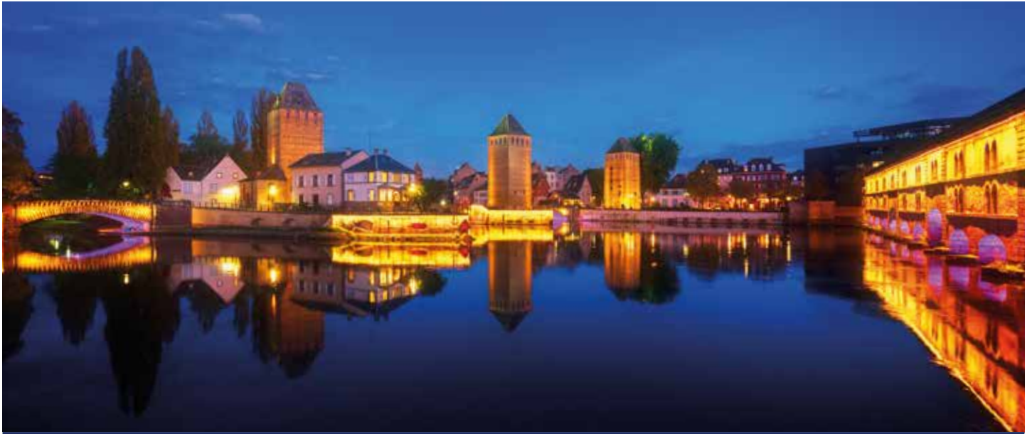
Die Ponts-Couverts befinden sich im historischen Zentrum Straßburgs

Nostalgische Städte, ein malerischer Fluss und eine tolle Silvester-Gala an Bord – was will man mehr? An den Ufern stehen die stolze Festung Ehrenbreitstein, die sagenumwobene Loreley, die Weinstadt Rüdesheim und der Speyerer Kaiser- und Mariendom Spalier, wenn Sie sich auf den Weg ins neue Jahr machen. Beschwingt in Straßburg angelegt, feiern Sie um Mitternacht auf MS ROUSSE PRESTIGE ins neue Jahr hinein und sehen seinen ersten Abenteuern entgegen: Genießen Sie in Mannheim einen köstlichen Neujahresbrunch, wandeln Sie in Worms auf den Spuren der Nibelungen und überqueren Sie in Mainz den 50. Breitengrad. Abwechslungsreicher kann man kaum ins neue Jahr starten!