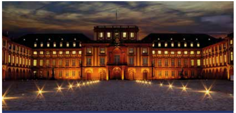
Schloss Mannheim entstand ab 1720 unter Kurfürst Carl Philipp als eines der größten absolutistischen Barockschlösser am Oberrhein