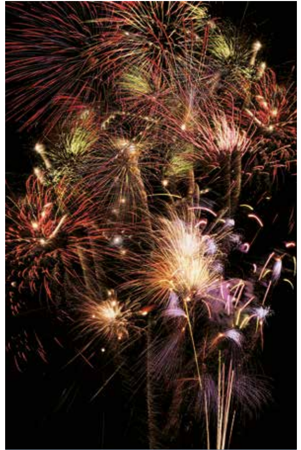
Feiern Sie Silvester mal anders

Alle Zeiten sind Richtzeiten. Programmänderungen, auch durch Hoch- und Niedrigwasser, oder Verzögerungen bei Schleusendurchfahrten sind vorbehalten. Das Landausflugsprogramm erhalten Sie ca. 6 Wochen vor Reisebeginn. Die Landausflüge sind nicht im Reisepreis enthalten. HT = Halbtagesausflug A = Abendausflug